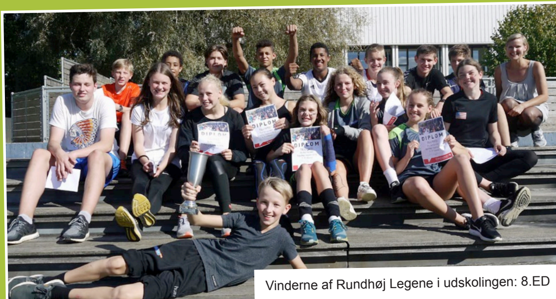
Vinderne af Rundhøj Legene i udskolingen: 8.ED