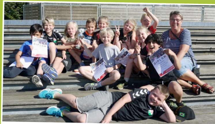
Vinderne af Rundhøj Legene i indskolingen: 3.B