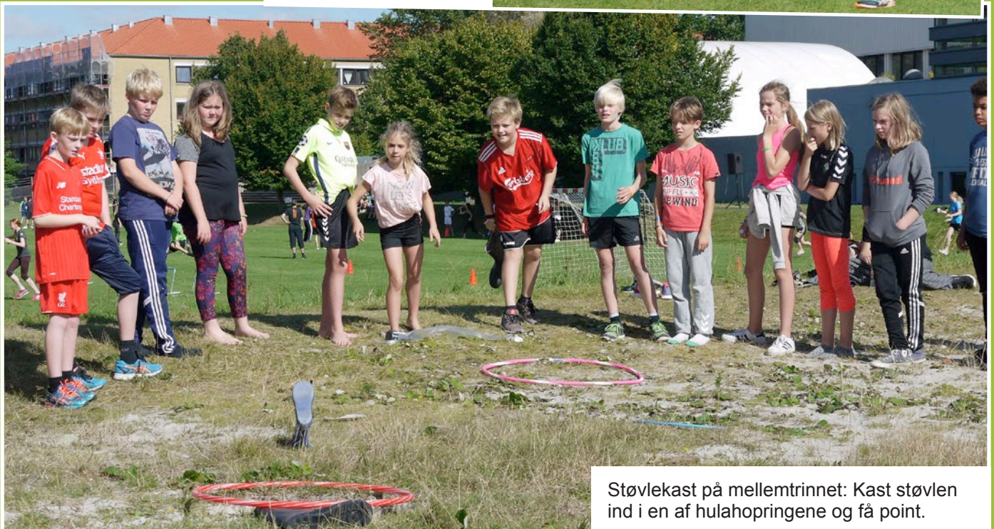
Støvlekast på mellemtrinet: Kast støvlen ind i en af hulahopringene og få point.