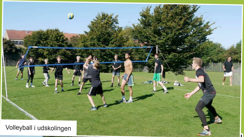
Volleyball i udskolingen