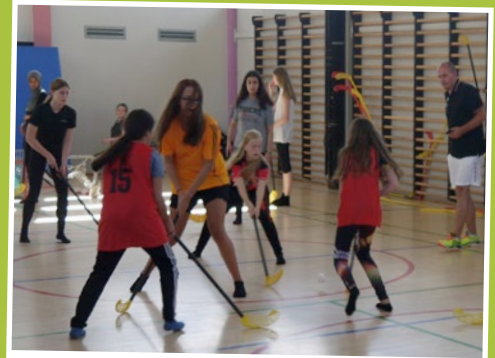
Intensiv indendørshockey i udskolingsklasserne.