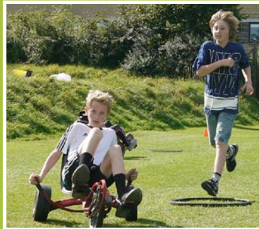
Mooncarræs på mellemtrinnet: Her gælder det om at have gode ben og en god evne til at styre uden om forhindringerne.