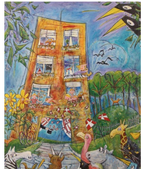
Ole Grøns 25-års-jubilæumsmaleri til Rundhøjskolen, fra 1991.

Eleverne var de første til at stimle sammen om Ole Grøn og hans maleri, efter at det blev offentliggjort ved skolens jubilæumsfest.