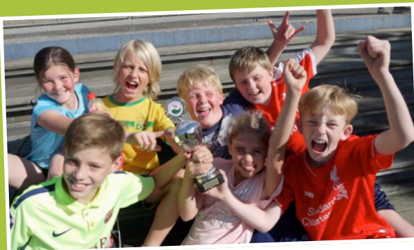
Vinderne af Rundhøj Legene på mellemtrinnet: Et hold fra 5.A