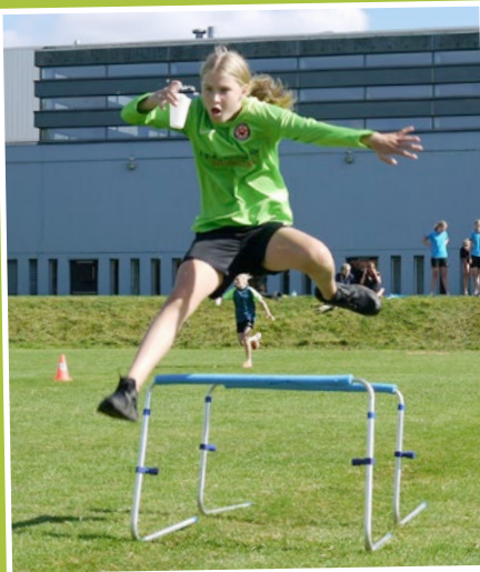
Hækkeløbsstafet med et krus vand i udskolingsklasserne: Balance og fart over feltet.